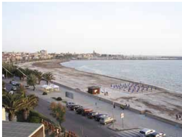
L'Alguer (Vista) 2009