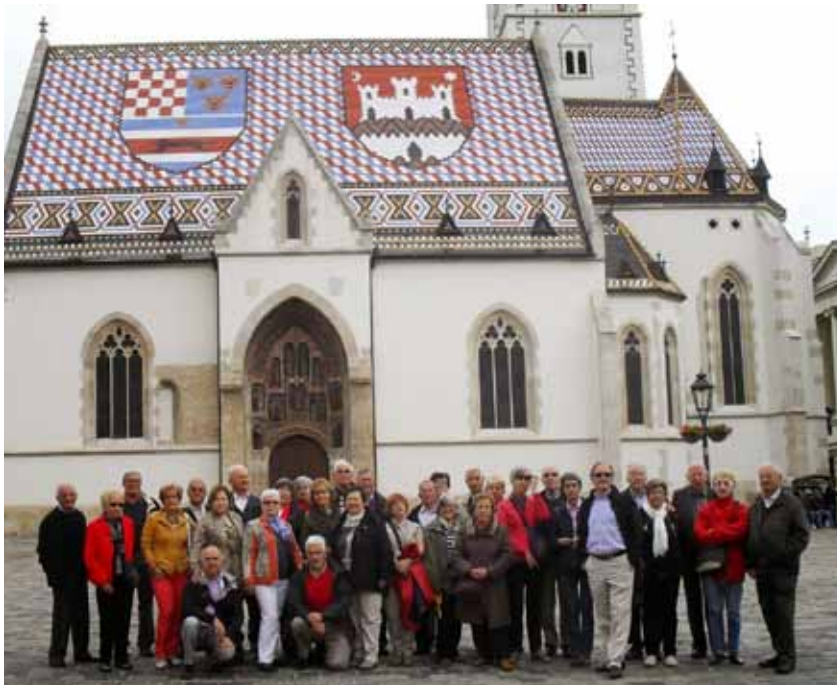
Croàcia (Zàgreb) 2013