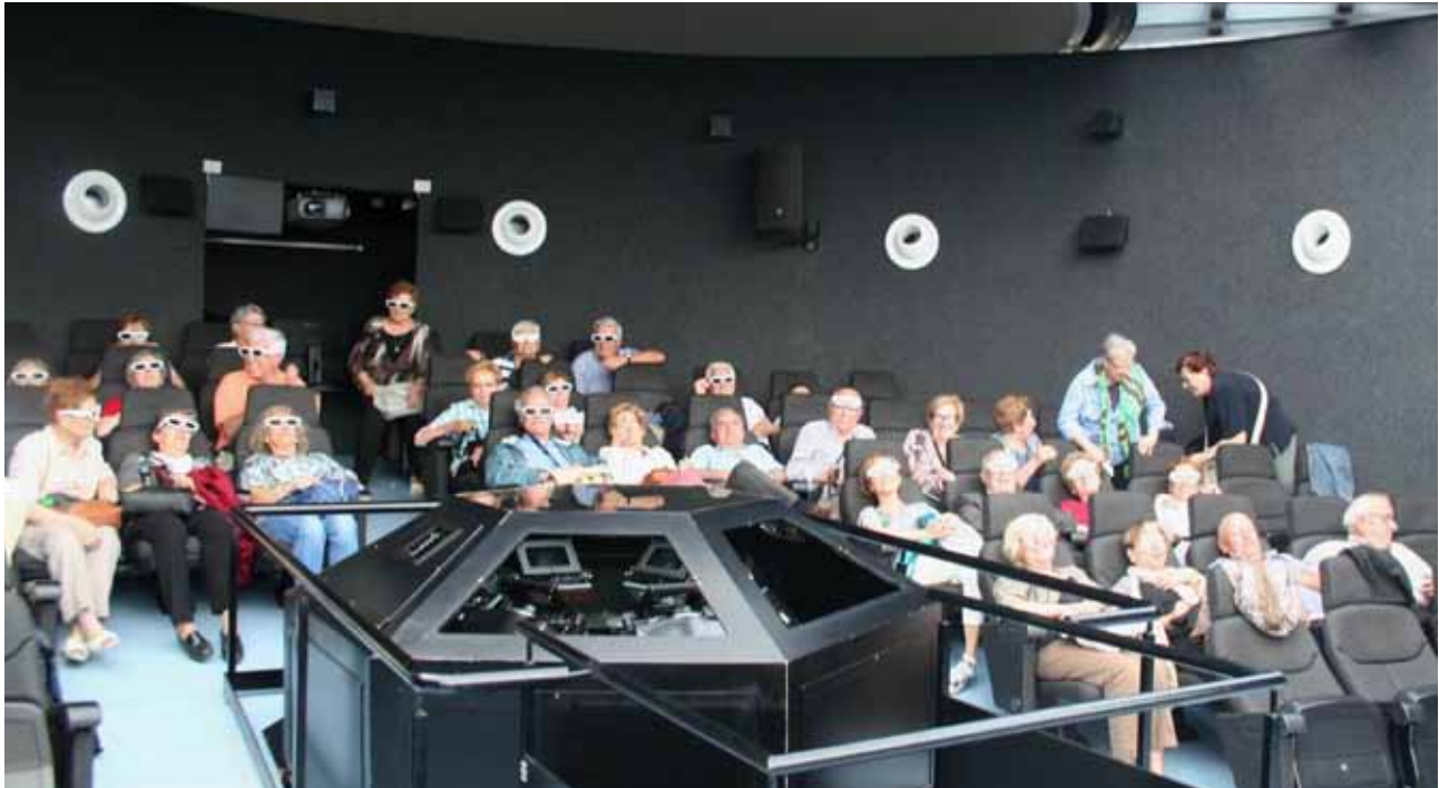
Observatori Montsec 2015