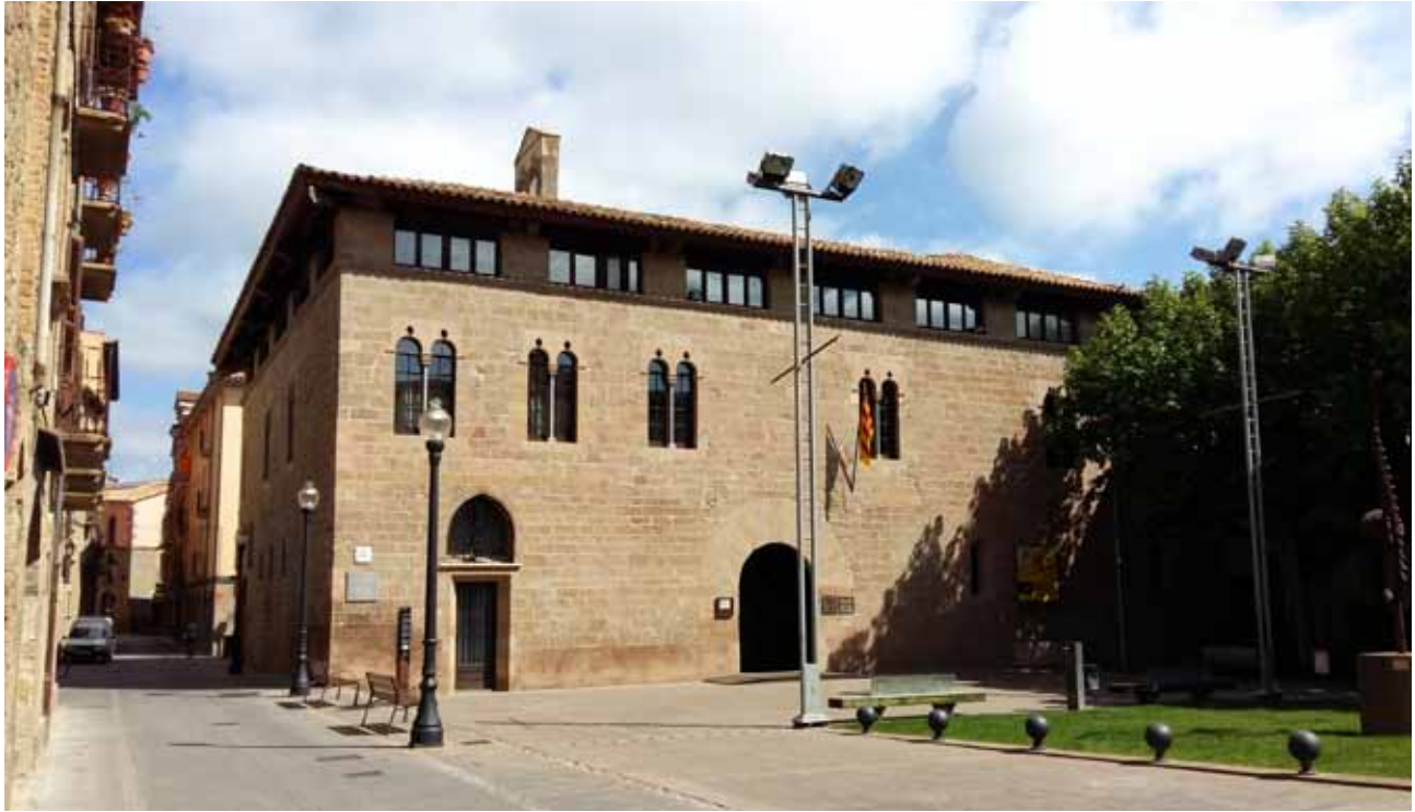
Palau Llobera, antiga universitat de Solsona i abans Hospital de Sant Miquel