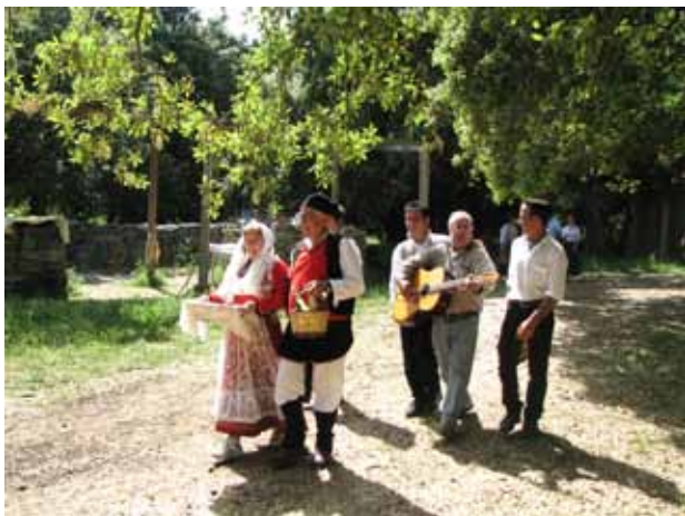
L'Alguer (Casament Sard) 2009