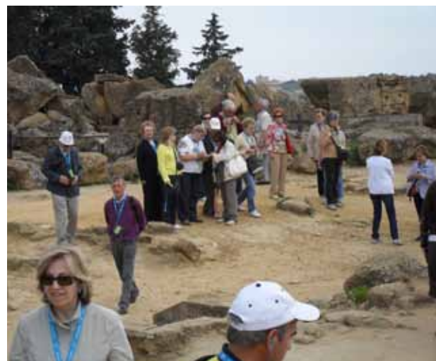
Sicilia (Vall dels Temples) 2010