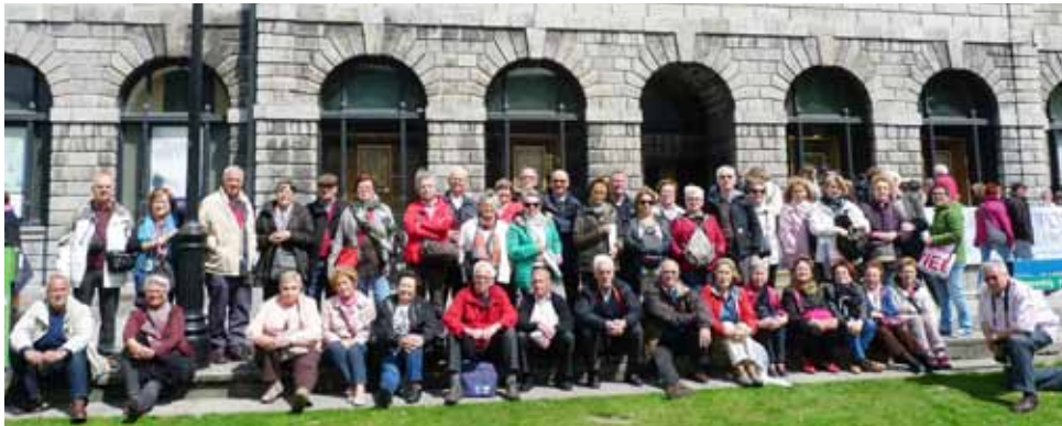
Irlanda (Trinity College) 2015