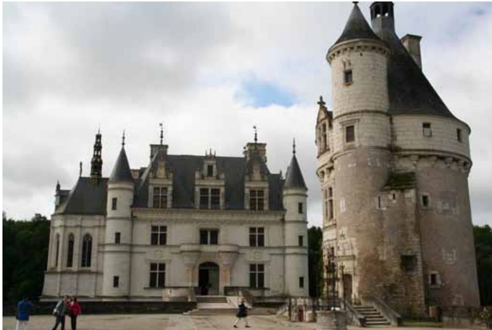
Bretanya i Normandia (Castell de Chenonceau) 2016

MÚSICA: PETITA HISTÒRIA DEL JAZZ (desembre-2015)