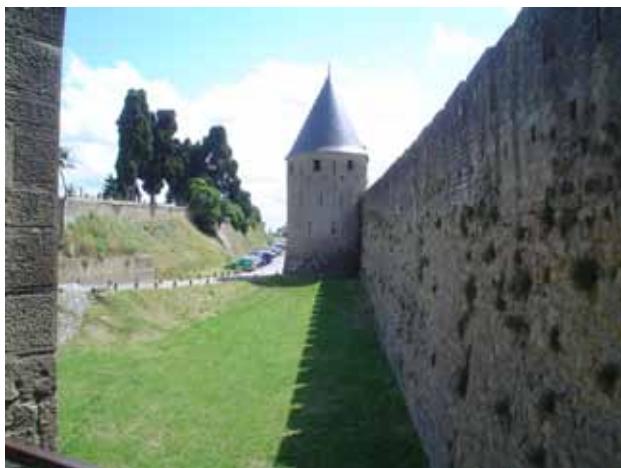
Sud de França (Castell de Carcassona) 2008