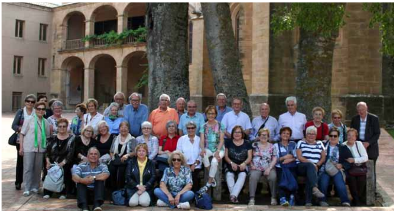
Monestir Avellanes 2015