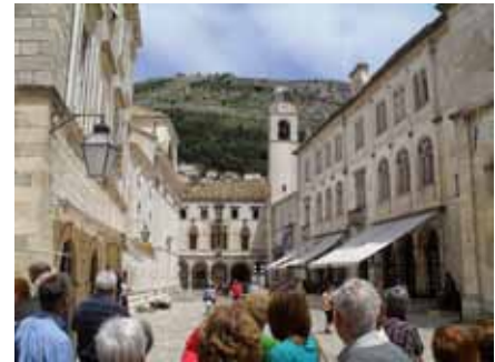
Croàcia (Dubrovnik) 2013