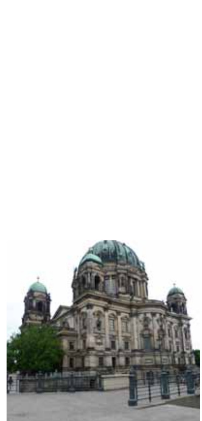
Berlín (Catedral) 2012