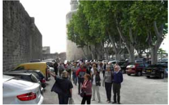
La Camarga 2011