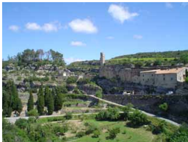
Sud de França (Minerve) 2008