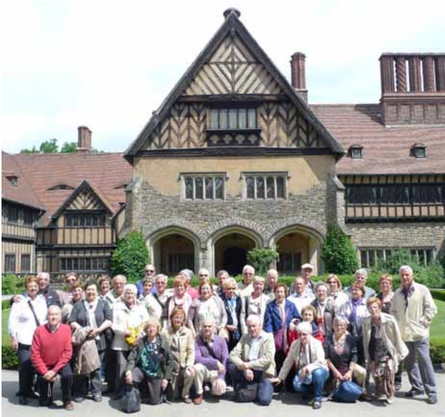
Berlín (Palau Cecilienhof) 2012