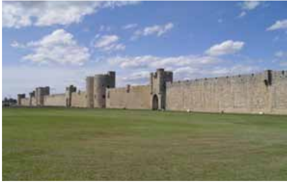
La Camarga 2011