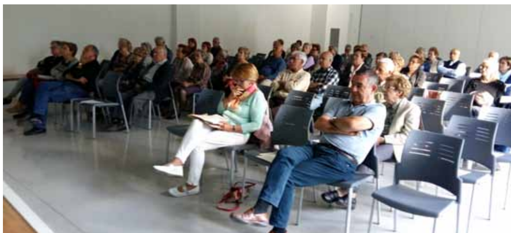
Centre Cívic "Xavier Jounou" 2016