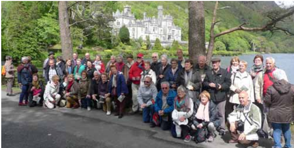
Irlanda (Abadia Kylemore) 2015