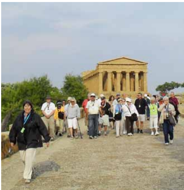
Sicilia (Agrigento) 2010