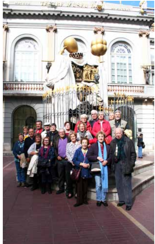
Figueres (Museu Dalí) Octubre 2015