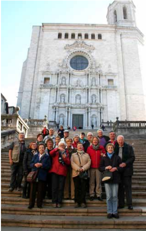
Girona (Catedral) Octubre 2015