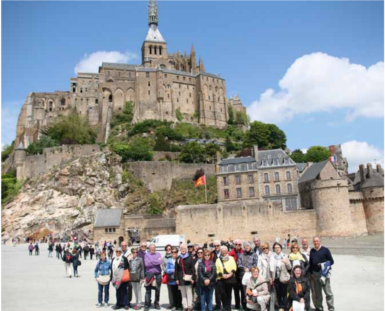
Bretanya i Normandia (Mont Saint Michel) 2016