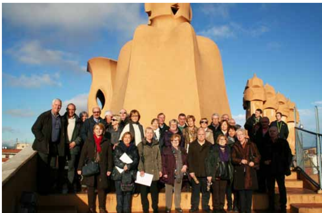
Barcelona (La Pedrera) 2015